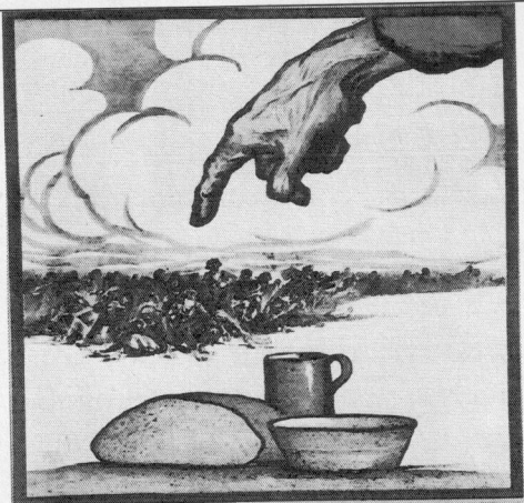
1 ПОМНИ ГОЛОДАЮЩИХ!

Выполните задания с иллюстрациями (2 балла за каждый ответ, максимальный балл – 12). Перед Вами плакаты, относящиеся к периодам нахождения у власти трёх различных лидеров СССР. Определите, о каких лидерах идёт речь, и укажите, к периоду нахождения у власти какого лидера относится каждый плакат.