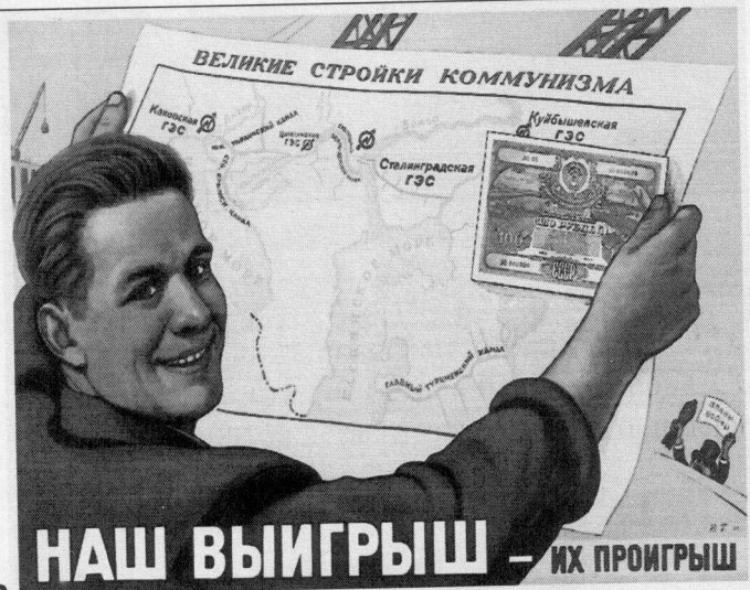
2 НАШ ВЫИГРЫШ — ИХ ПРОИГРЫШ