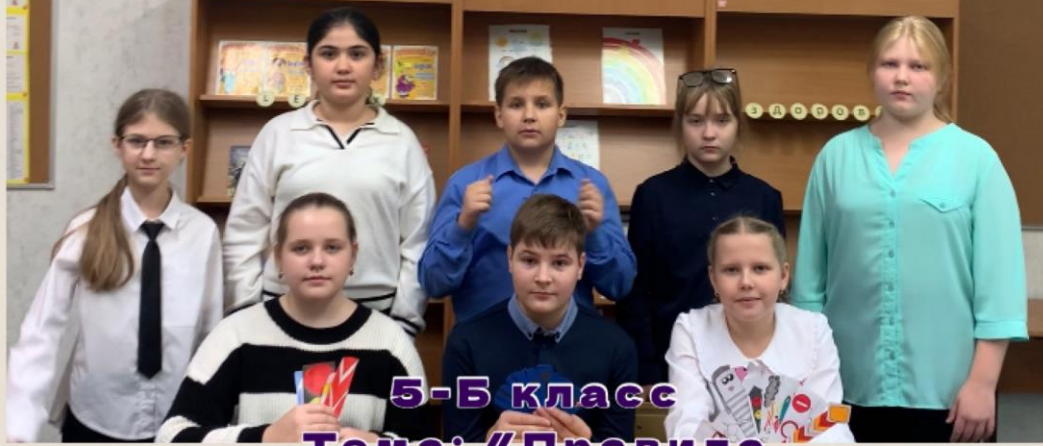
5-Б класс Тема: «Правила