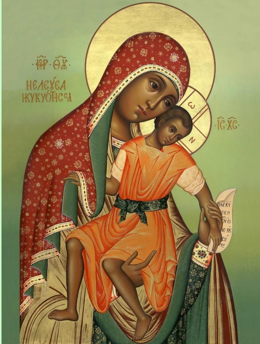
Икона Божией матери «Милостивая»